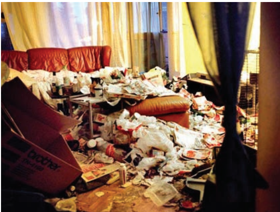
Illustration d'une accumulation d'objets caractéristique d'un syndrome de Diogène.